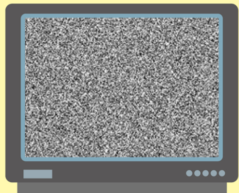
※画面はイメージです。